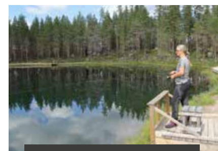
Stortjärn har gott om plats och passar därmed även perfekt för fiskeutflykter för skolklasser eller arbetsplatser.