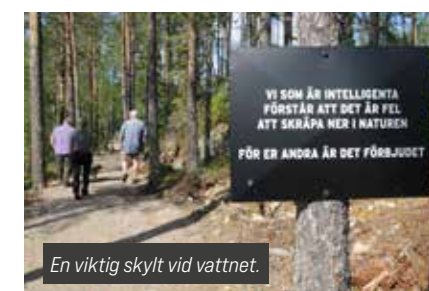
En viktig skylt vid vattnet.

Läs mer och hitta hit: www.fiskaiberg.se Köp Fiskaiberg-kortet: www.fiskekort.se/fiskaibergpasset