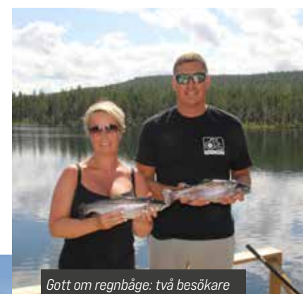
Gott om regnbåge: två besökare som knäckte koden och fick fisk.

olika naturvatten och mer är på gång. Verksamheten är en del av satsningen FiskeDestination Berg som i grunden är ett mångårigt Leaderprojekt för att utveckla och marknadsföra det mycket varierande och attraktiva fisket i kommunen. Förutom olika info-satsningar och skyltning av fiskevattnen har man även skapat ett särskilt fiskekort som gäller på över hundra vatten i kommunen: Fiskaiberg-kortet. Under 2020 utbildades 20 fiskevårdare i bland annat guidning, värdskap och marknadsföring. Man har också medverkat i flera avsnitt av TV-programmet FiskeDestination.